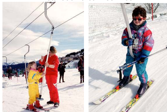
Installation à cannes fixes

Téléski du Plan-Marmet sur le site des Savagnières transition entre le téléski à cannes fixe et les grandes installations